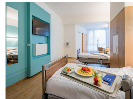
besondere Services für Wahlleistungspatienten

Unsere Serviceassistentinnen stehen Ihnen bei Fragen und Wünschen zur Verfügung. Beispielsweise nehmen Sie Ihre individuellen Essenswünsche aus, befüllen den Kühlschrank und reichen Ihnen (Zwischen)Mahlzeiten und Getränke.