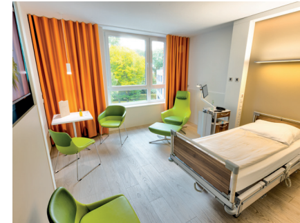
moderne Einzelzimmer auf Station 2c

Die Einrichtung der Station erinnert an ein Hotel: Alle Ein- und Zwei-Bettzimmer sind modern und hochwertig ausgestattet und verfügen über eine bodenbündige Nasszelle. Ein zwischen den Betten platzierter Schrank mit fest verbautem Safe schafft auch im Zweibettzimmer Privatsphäre. Bei Ihrer Ankunft erhalten Sie auf Wunsch außerdem eine kleine Kulturtasche mit den wichtigsten Hygieneartikeln. Auch halten die Servicekräfte Handtücher und Bettwäsche bereit und wechseln diese auf Wunsch täglich.