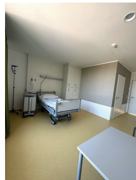
Auf Station 3C warten modern ausgestattete 1- und 2-Bettzimmer auf unsere Patientinnen und Patienten. Alle Zimmer verfügen über ein eigenes Bad und sind großzügig geschnitten.